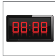
10 - 15 saniye presleme